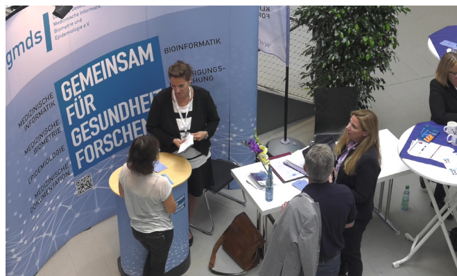
GMDS-Jahrestagung 2018 in Osnabrück

21. - 25. August 2022, Kiel, weitere Informationen folgen