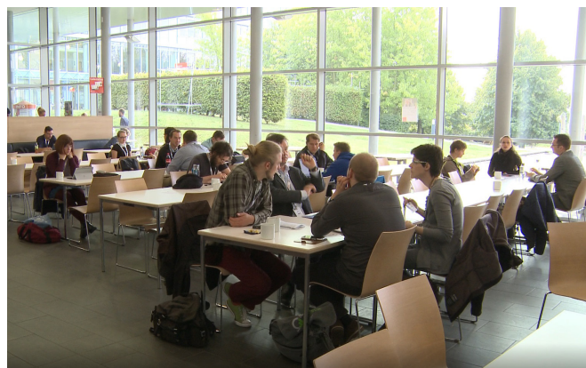
GMDS-Jahrestagung 2019 in Dortmund